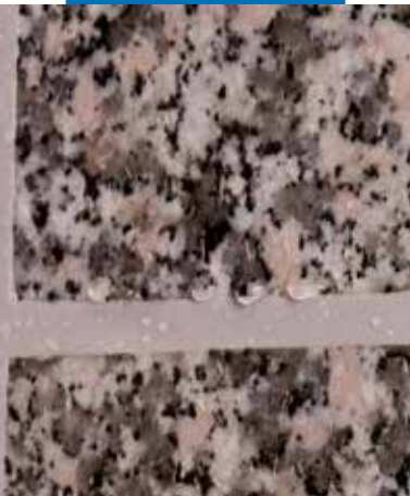
afdichten van stenen bekleding buitenshuis

Mapesil LM is verpakt in hulzen van 310 ml. Snijd voor gebruik de huls aan de bovenzijde bij het draadeind open. Schroef de spuitmond er op en snijd vervolgens deze onder een hoek van 45° open op basis van de breedte van de voeg. Plaats de huls in het pistool en de kit is spuitklaar.