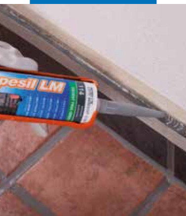
afdichten van stenen bekleding binnenshuis