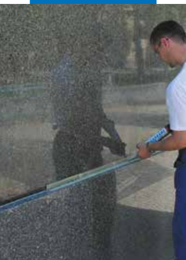
Afdichten van een gevelvoeg met Mapesil LM

Referentiemateriaal over dit product is op verzoek verkrijgbaar en te vinden op de Mapei-website www.mapei.be , www.mapei.nl en www.mapei.com